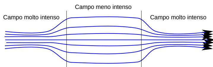
Fig. 6.1: schematizzazione del campo magnetico nella bottiglia magnetica.

Il principio che è alla base della bottiglia magnetica, meglio conosciuta come specchio magnetico , è stato per anni la speranza di riuscire a riprodurre in laboratorio la fusione fredda . Infatti, utilizzando questo fenomeno, si possono ingabbiare delle particelle in una determinata regione di spazio. Consideriamo lo schema in figura 6.1: il campo magnetico è molto intenso agli estremi, mentre è più debole nella “pancia” centrale. Una particella inserita in questo campo avrà la velocità in due componenti separate, v_{\perp} e v_{\parallel} . La velocità parallela v_{\parallel} , quando la particella esce dalla pancia ed entra in una delle zone a campo più intenso, diminuisce man mano fino a diventare nulla: a quel punto sarà presente solo una componente perpendicolare v_{\perp} che respinge indietro la particella. Il processo va avanti all’infinito e la particella resta ingabbiata nella zona a campo meno intenso; tuttavia, le traiettorie che questa può seguire possono essere molto complicate e non proprio banali.